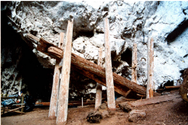
โลงไม้ขนาดยาวประมาณ 5 เมตร ที่แหล่งโบราณคดีเพิงผาบ้านไร่

ขนาดของโลงไม้ที่พบมีตั้งแต่ยาวน้อยกว่า 1 เมตร ไปจนถึงยาวกว่า 9 เมตร ความกว้างของตัวโลงจึงแตกต่างกันไปบางโลงเล็กเกินกว่าที่คนจะลงไปนอนได้ ประกอบกับการจัดจำแนกโครงกระดูกที่พบร่วมกับโลงไม้ที่บางแห่งมีโลงเพียงหนึ่งโลงแต่กลับพบโครงกระดูกของคน 9 คน ทำให้นักโบราณคดีสันนิษฐานว่าเป็นไปได้ที่จะเป็นการฝังศพแบบที่ปลงศพมาแล้วหรือเอาเฉพาะโครงกระดูกมาวางรวมไว้ในโลงด้วยกัน พบทั้งโครงกระดูกเด็ก วัยรุ่นและผู้ใหญ่ มีทั้งผู้ชายและผู้หญิง คนตายบางคนมีการตกแต่งพื้นหน้าด้วยการฝังโลหะเงินทองเป็นจุดๆ บนพื้นเข้าไปด้วย