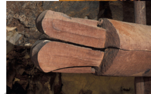
(บน) หัวโลงรูปสัตว์ (ล่าง) หัวโลงรูปแท่ง จากแหล่งโบราณคดีบ้านบ่อไคร้